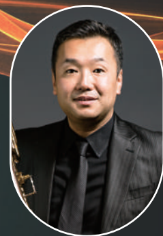
Eijiro Nakagawa, trombone

5歳でトロンボーンを始め、高校在学中に初リーダー作をニューヨークで録音。名だたるビッグ・アーティストとの共演を始め、映画、CM、TVなど多くの録音でも知られる。2007年、日本人として初めてトニー賞授賞式に出演し、2008年にはNHK連続テレビ小説『瞳』のメインテーマを演奏。2018年にはジョセフ・アレッシらとともに「SLIDE MONSTERS」を結成。同時に発表したデビューアルバムは、iTunesチャート、Billboard総合チャートへ異例のチャートインを果たしMVの総再生回数は現在までに130万回を超えるなど、既存のジャンルを超えた唯一無二のアンサンブルとなった。2019年には豪メルボルンで開催された「International Jazz Day」に出演。読売日本交響楽団、大阪フィルハーモニー交響楽団、東京交響楽団、新日本フィルハーモニー交響楽団、札幌交響楽団、京都市交響楽団、山形交響楽団など、国内主要オーケストラとも共演するなど、ジャンルを超えて多彩な才能を発揮。日本を代表する世界的トロンボーン奏者として幅広い活動を行っている。 https://linktr.ee/ejironakagawa