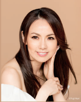
Maki Mori 森 麻季 [soprano]

名実ともに日本を代表するオペラ歌手・森麻季が、2年ぶりにおおたかの森ホールに登場します。透明感のある美声、コロラトゥーラの完璧なテクニック、そして深い音楽性。並ぶ者のない、文字どおりのプリマドンナです。誰もが魅了される華やかな舞台をお聞き逃しなく。